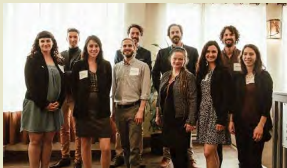
Le comité organisateur