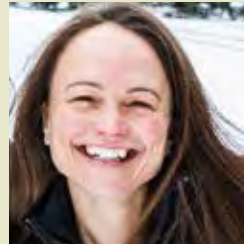
Nadya Baron Tourisme