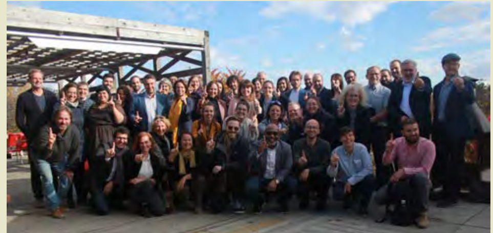
À l'issue de l'événement, les participants au dîner-conférence ont manifesté leur intérêt à engager la transition vers l'économie de la fonctionnalité et de la coopération.

En octobre dernier, à Saint-Paulin en Mauricie, se tenait un consortium de six régions, dont l'Estrie, sur l'Économie de la Fonctionnalité et de la Coopération au Québec (EFC Québec). Près d'une soixantaine de dirigeants, de représentants de l'écosystème d'accompagnement aux entreprises comme le CLD, de personnalités du développement durable et de contributeurs au programme EFC Québec y ont pris part lors d'un dîner-conférence pour présenter les leviers et les facteurs d'implantation de l'économie de la fonctionnalité et de la coopération ainsi que l'expérience et les avancées des entreprises accompagnées depuis mai 2021.