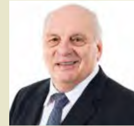
Claude Dubois Maire de la ville de Bedford