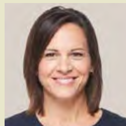
Isabelle Charest Députée de Brome-Missisquoi