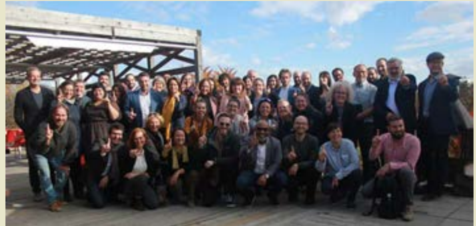
À l'issue de l'événement, les participants au dîner-conférence ont manifesté leur intérêt à engager la transition vers l'économie de la fonctionnalité et de la coopération.

En octobre dernier, à Saint-Paulin en Mauricie, se tenait un consortium de six régions, dont l'Estrie, sur l'Économie de la Fonctionnalité et de la Coopération au Québec (EFC Québec). Près d'une soixantaine de dirigeants, de représentants de l'écosystème d'accompagnement aux entreprises comme le CLD, de personnalités du développement durable et de contributeurs au programme EFC Québec y ont pris part lors d'un dîner-conférence pour présenter les leviers et les facteurs d'implantation de l'économie de la fonctionnalité et de la coopération ainsi que l'expérience et les avancées des entreprises accompagnées depuis mai 2021.