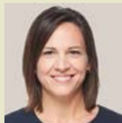
Isabelle Charest Députée de Brome-Missisquoi