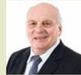
Claude Dubois Maire de la ville de Bedford