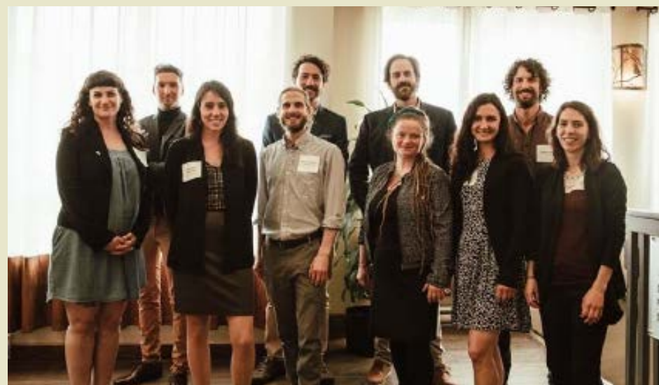
Le comité organisateur