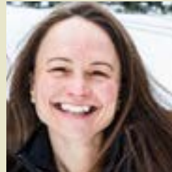
Nadya Baron Tourisme